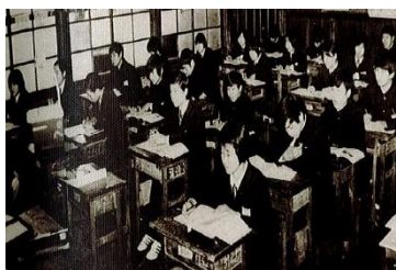
↑ 昭和48年度神山校舎木製の机を使用しています