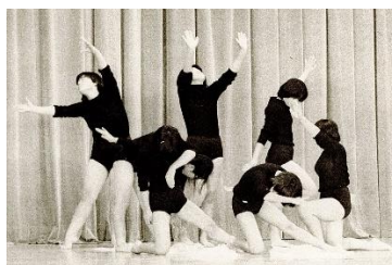
↑ 昭和52年度創作ダンス あるテーマに沿って自分たちでダンスを考えて踊っていました