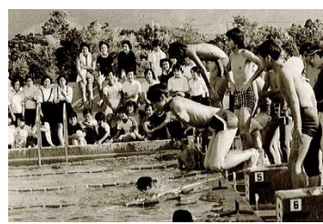
↑ 昭和50年度 当時はプールを使用していました